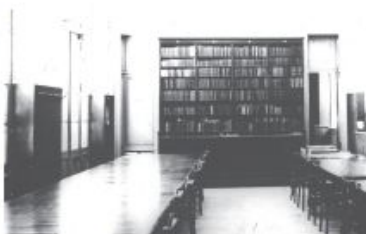
Sala de lectura de la Biblioteca de la Facultad de Ciencias Exactas, Físicas y Matemáticas (FCSEyF) en 1907.

Libros y revistas acompañan naturalmente la formación de los estudiantes y la investigación en la Facultad, pero ¿Cuándo nació la Biblioteca de la FCEN? Es una minuciosa lectura sobre Actas de la Academia y del Consejo Directivo, Anales de la UBA, Memorias de la Facultad, la Revista de nuestra Universidad y documentos del Archivo Histórico de la UBA, aparecieron huellas de los primeros pasos de nuestra Biblioteca que permiten seguir en los espacios que ocupaba en la manzana de las Luces, en la reunión de colecciones, la selección de empleadas y en las definiciones que ese organismo en formación exigía a las autoridades universitarias, la evolución y jerarquización de la Biblioteca para la Facultad de Ciencias durante las décadas posteriores a la creación del Departamento de Ciencias Exactas.