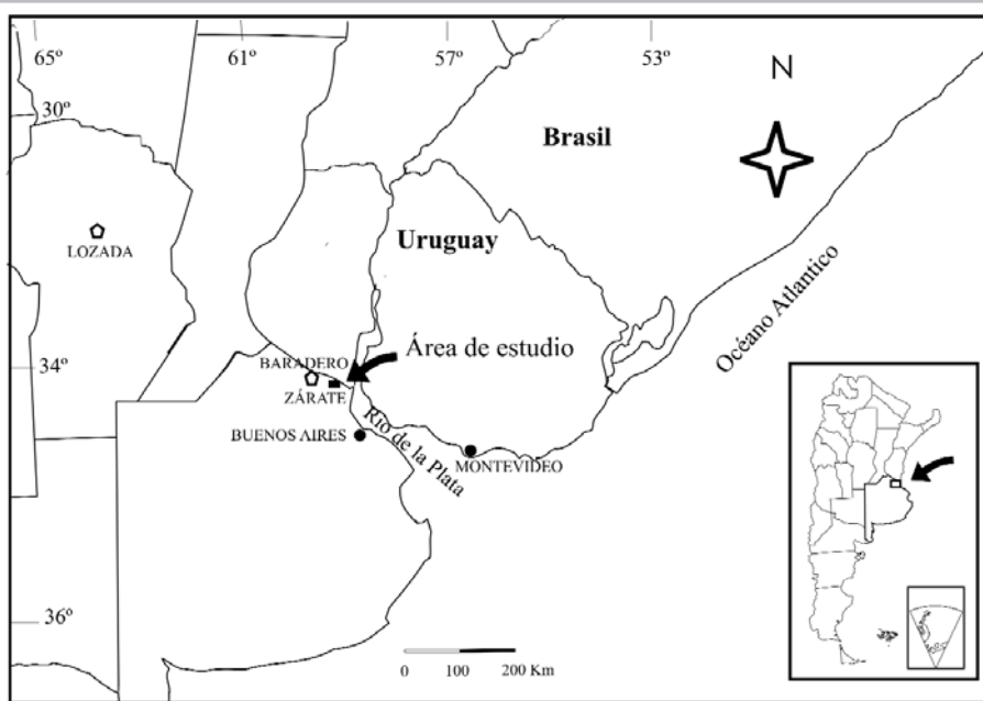
Figura 1: Mapa de ubicación.

longado del Pleistoceno tardío (aproximadamente 30 Ka), cuya duración prácticamente duplica la de otros intervalos interglaciales del Cenozoico tardío.