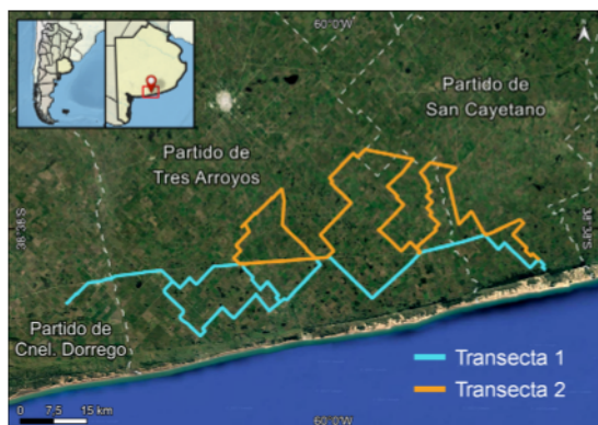
Figura 1. Área de estudio en el sur de la provincia de Buenos Aires. Mapa base: Instituto Geográfico Nacional RA (base de datos geoespacial), ©2022 Google (imagery), Natural Earth (raster data).

Los muestreos de cauquenes se realizaron utilizando el método de transecta de ancho fijo, principalmente sobre caminos secundarios (Davis y Winstead 1980, Tellería 1986, Galindo Leal 1997). La elección de este método de muestreo se estableció con la finalidad