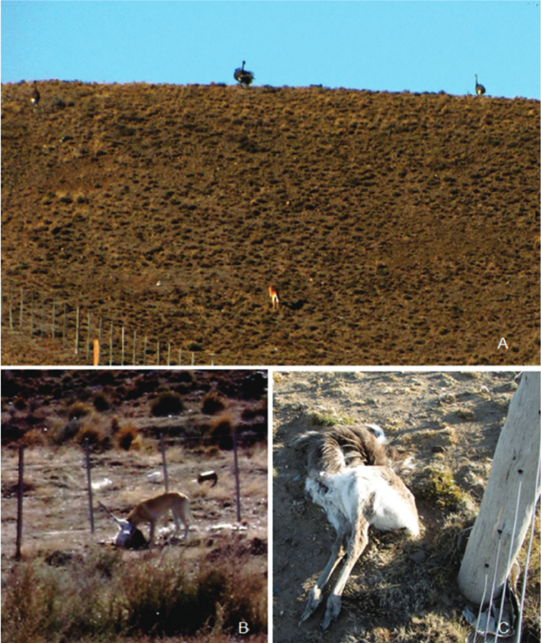
Figura 3. Ataques de perros no supervisados a choiques. (A) Perro persiguiendo una bandada de choiques. (B) Perro matando a un choique acorralado en un alambrado y (C) Choique adulto muerto por perro no supervisado al lado del alambrado.