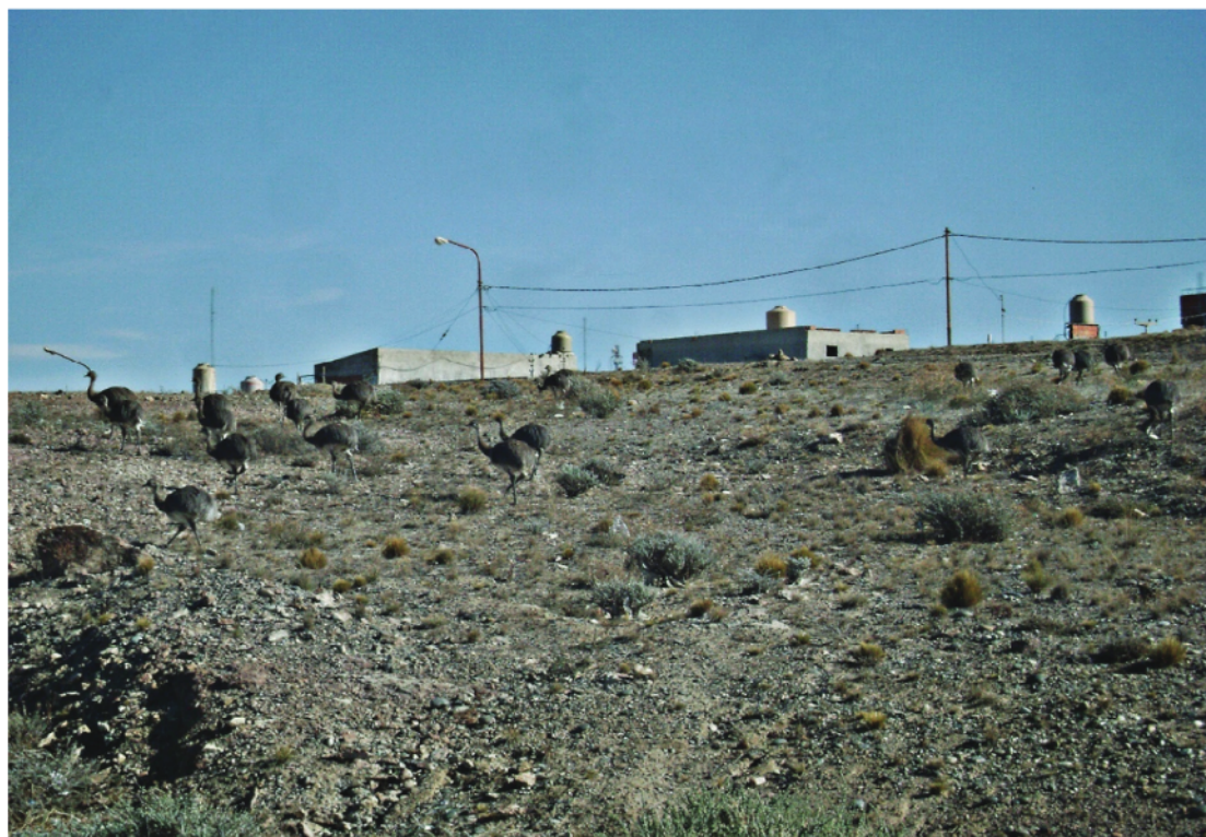
Figura 2. Bandada de choiques ingresando al ejido urbano de la ciudad de Puerto Deseado.

choiques/km 2 en las zonas de mayores incidencias (Fig. 1). La mayor densidad de choiques muertos por perros (64% del total) se registró en cercanías de los alambrados que rodean el basural municipal y el autódromo local, ambos distando a 1500 metros del ejido urbano (Fig. 1). Estas muertes ocurrieron en promedio a 226 \pm 224 metros de distancia de la zona de influencia de perros no supervisados y en promedio a 46 \pm 84 metros de los alambrados. El 36% restante de los choiques fueron cazados en promedio a 395 \pm 309 metros de distancia de la zona más cercana a la ciudad con influencia de perros no supervisados, incluso algunos choiques han sido cazados cuando ingresaron al ejido urbano, siguiendo como límite la costanera de la ciudad. En promedio estos últimos ataques también ocurrieron a una distancia similar ( 46 \pm 47 metros) a alambrados, caminos y costanera (Fig. 1).