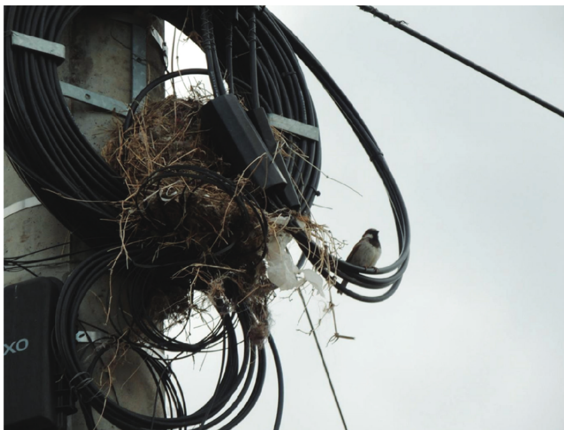
Figura 3. Nido de Benteveo ( Pitangus sulphuratus ) reutilizados por Gorrión ( Passer domesticus ) en poste de cableado eléctrico en el Gran San Miguel de Tucumán, Tucumán, Argentina.

Sobre los materiales empleados en la construcción de los nidos, observamos tanto materiales naturales como artificiales (Figs. 2, 4A, 4B). Los naturales encontrados fueron hojas, gramillas, ramas y plumas; y en los artificiales plásticos (porciones de bolsas, cintas, tiras de escoba de plástico), hilos, algodones y fibras sintéticas. El promedio de material artificial por nido para el Sector 1 fue de 25 ( n = 10 ), para el Sector