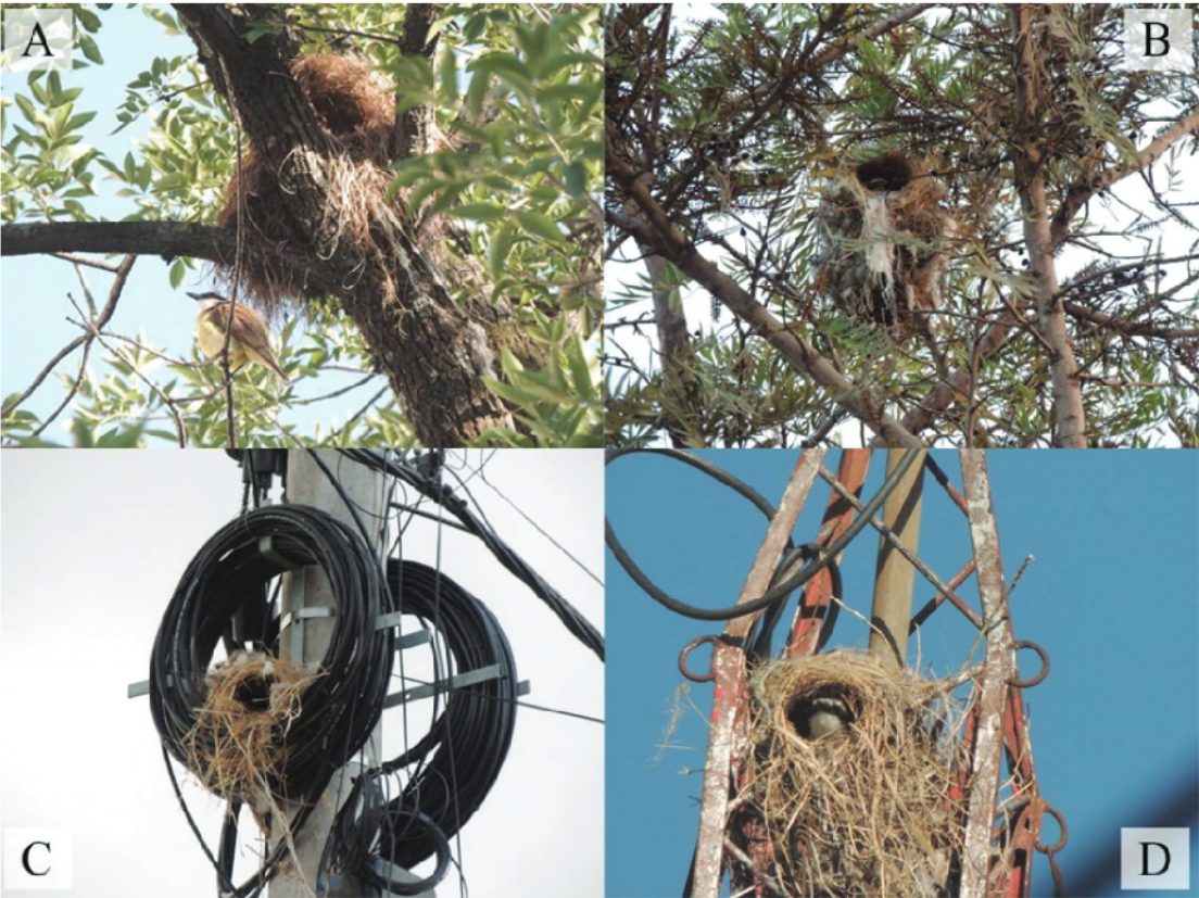
Figura 4. Nidos de Benteveo ( Pitangus sulphuratus ) con material sintético (A y B), nido de Benteveo ( Pitangus sulphuratus ) ubicado en poste de cableado urbano (C) y nido de Benteveo ( Pitangus sulphuratus ) ubicado en antena de radio transmisión (D) en el Gran San Miguel de Tucumán, Tucumán, Argentina.

concreto, y uno en el Sector 1 en una antena de radio transmisión. Dos de estos nidos fueron exitosos (Figs. 4C y 4D). El número de especies arbóreas utilizadas como soporte de nidos fue de 19. Las especies de Jacarandá, Ficus y Lapacho Rosado fueron las más utilizadas