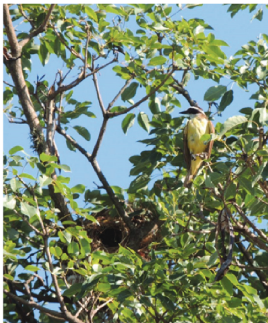
Figura 2. Nido de Benteveo ( Pitangus sulphuratus ) en el Gran San Miguel de Tucumán, Tucumán, Argentina.

Se observó que la temporada de reproducción del Benteveo fue de octubre a febrero. En los sectores 1 y 3 la actividad se inició en noviembre, mientras que en el Sector 2 en el mes de octubre. La temporada de reproducción fue de 50 a 70 días; para el Sector 1 fue de 50 \pm 24 días, para el Sector 2 fue de 56 \pm 27 y para el Sector 3 fue de 46 \pm 28 días (Material Suplementario, Apéndice). Se observó un total de 319 individuos adultos de benteveos. La abundancia relativa para el Sector 1 fue de 16 \pm 3 , para el Sector 2, 16 \pm 6 y para el Sector 3, 13 \pm 2 (Tabla 1). Los análisis arrojaron que no hubo diferencias significativas entre el número promedio de días de la temporada reproductiva (Kruskal-Wallis H = 1.45 ; p = 0.483 ) y la abundancia relativa promedio de Benteveo (Kruskal-Wallis H = 2.68 ; p = 0.257 ) entre los diferentes sectores.