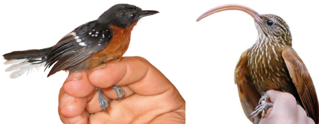
Figura 2. Dos aves indicadoras de pacal en la región de Camisea (Perú) de amplia distribución en el continente Americano: Hormiguerito de Ala Punteada ( Microrhoptia quixensis , izquierda) y Picapalo Colorado ( Campylorhynchus trochilostrius , derecha).

hasta el momento en que el bambú muere, mientras que las aves granívoras siguen las explosiones de floración y fructificación, y aumentan sensiblemente sus abundancias en periodos acotados (Areta y Cockle 2012). Sin embargo, el tamaño de los frutos de G. sarcocarpa (la especie dominante de bambú en Camisea), es demasiado grande para la mayoría de las aves granívoras frecuentes en otros bosques de bambú de la Amazonia (e.g. algunas especies de los géneros Paraclaravis , Sporophila y Amaurospiza ; Londoño y Peterson 1991, Neudorff y Blanchfield 1994, Olivier y Poncy 2009). La Paloma de Pecho Marrón ( Paraclaravis mondetoura ), paloma de tamaño mediano que se distribuye exclusivamente en bosques de bambú (Stotz et al. 1996, Schulenberg et al. 2007, Baptista et al. 2020), fue la única especie de ave granívora que registramos en un evento de floración y fructificación de cañas en los pacales de Camisea, pero con una frecuencia tan baja que no alcanzó los valores de IV para ser considerada indicadora de pacal.