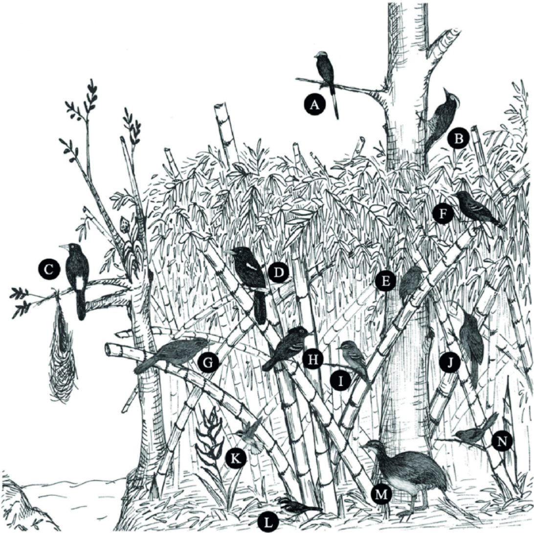
Figura 3. Localización y uso por parte de las aves especialistas de pascal de las diferentes áreas dentro de un pascal de Camisea: A) Yetapá Negro ( Colonia colonus ), B) Carpintero de Penacho Amarillo ( Melanerpes cruentatus ), C) Cacique de Selva ( Cacicus koepckeae ), D) Monja de Pico Amarillo ( Monasa flavirostris ), E) Carpinterito de Pecho Rufo ( Picumnus rufiventris ), F) Hormiguero de Manu ( Cercomacra manu ), G) Pico-Recurvo Peruano ( Sindaetila ucayalae ), H) Hormiguero de Líneas Blancas ( Myrmoborus lophotes ), I) Pico Chato Cabezón ( Ramphotrigon megacephalum ), J) Picapalo Colorado ( Campylorhamphus trochilirostris ), K) Ermitaño Rojizo ( Phaethornis ruber ), L) Gorrión Pectoral ( Arremon taciturnus ), M) Perdiz de Gorro Negro ( Crypturellus atropurillus ) y N) Coliespina de Garganta Castaña ( Synallaxis cherriei ). Ilustración: Luis Pagano.

distribuidas irregularmente, que están siendo fuertemente afectadas por la fragmentación del hábitat (BirdLife International 2021a). Esta especie fue descrita hace menos de quince años (Lane et al. 2007) en base a una piel depositada en el Museo de Historia Natural de San Marcos (originalmente determinado erróneamente como Casiornis rufa ) y a tres especímenes colectados junto a información sobre su comportamiento, vocalizaciones y uso de hábitat en el marco del Programa de Monitoreo de la Biodiversidad de Camisea. Para el Cacique de Selva, especialista de pascal susceptible a la fragmentación y modificación de su hábitat, se espera que, de seguir la tendencia