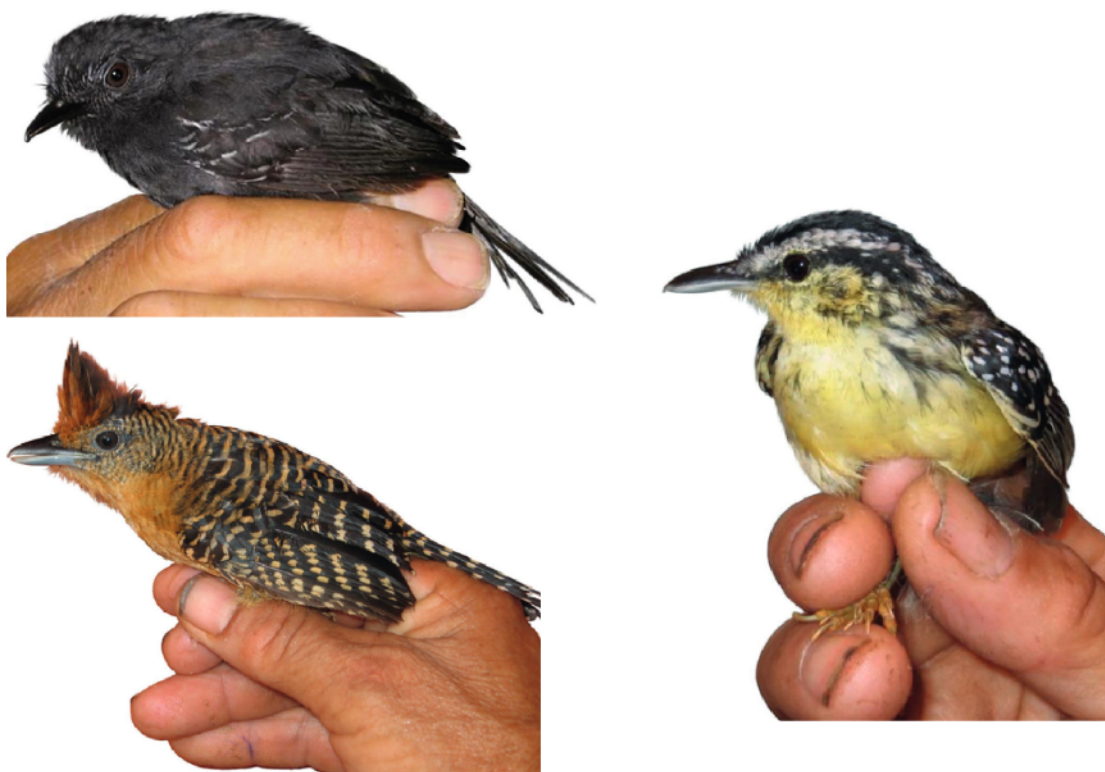
Figura 4. Especies indicadoras de pacal reconocidas a partir de la diferenciación de formas anteriores. Arriba a la izquierda, Homíguero de Manu ( Cercomacra manu ). A la derecha, Homíguero de Pecho Amarillo ( Hypocnemis subflava ). Abajo a la izquierda: Batará de Bambú ( Cymbilaimus sanctae-mariae ).

Los bosques de bambú son un ambiente propicio para la diferenciación de linajes. Indagar acerca de la historia de vida de las aves de bambú arrojará nuevas evidencias para el reconocimiento de su singularidad. Hallazgos recientes como el Alitorcido Rufo, una especie completamente nueva y especialista de pacal, demuestra que los bosques de bambú esconden todavía tesoros naturales.