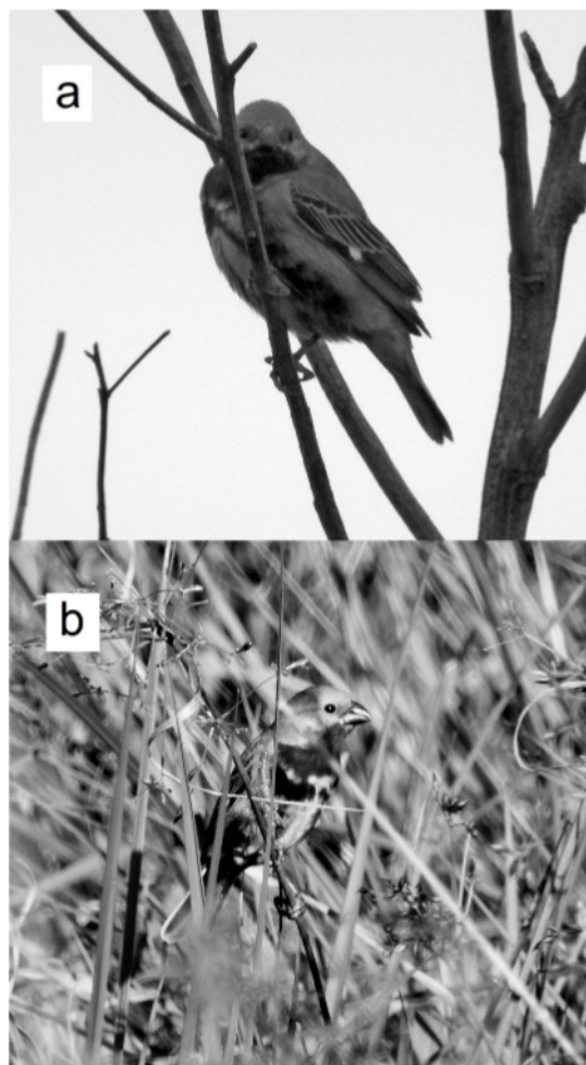
Figura 2. Ejemplar macho de Capuchino Vientre Negro ( Sporophila melanogaster ) registrado el día 21 de noviembre (a) y el 23 de noviembre (b) de 2017 en la Reserva Natural Urutau, Misiones. En la segunda fotografía, se observa al ejemplar consumir semillas de Paja Amarilla ( Sorghastrum setosum ).

La RNU se encuentra a la misma latitud que varias zonas de cría del Capuchino Vientre Negro, como el Municipio de Agua Doce, en el estado de Santa Catarina, ubicado unos 400 km al este de Candelaria (eBird 2020). Esta reserva presenta una fisonomía y composición de especies muy similar a las utilizadas por esta especie en su área de cría (Rovedder 2011), con bajos hidrófilos dominados por A. lateralis , P. intermedium , Juncus sp. y Eleocharis sp. De las 25 especies citadas en la dieta de esta especie (Rovedder 2011), al menos 10 se encuentran presentes en la RNU y la gran mayoría de las restantes están citadas para el municipio de Candelaria (Zanotti et al. 2020). La plan-