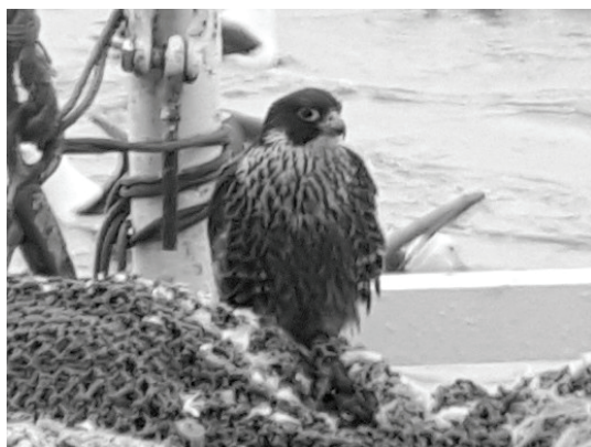
Figura 2. Individuo de Halcón Peregrino ( Falco peregrinus ) con su presa (un Paiño Común Oceanites oceanicus ) posado sobre una red de pesca de polipropileno en un buque pesquero en el Mar Argentino.

La presencia de esta rapaz en esta zona del Atlántico Sudoccidental puede haber tenido