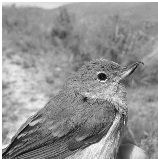
Figura 1. Hembra de Payador Canela ( Diglossa sittoides ) capturada en febrero de 2014 en El Infiernillo, Tafí del Valle, Tucumán.

El primer nido, encontrado el 2 de enero, tenía un diámetro de 9 cm, un diámetro interno de 4.9 cm, una profundidad de 5.4 cm