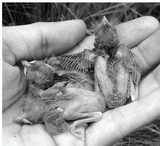
Figura 4. Pichones de Payador Canela ( Diglossa sittoides ) en El Infiernillo, Tañí del Valle, Tucumán.