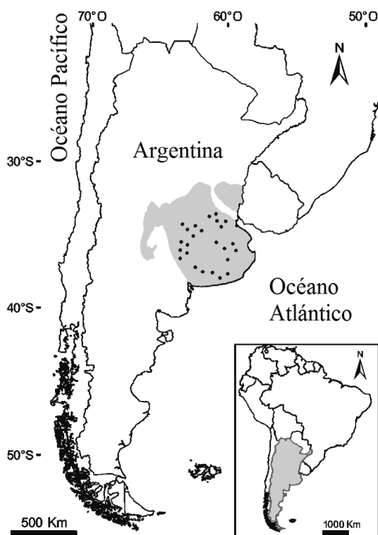
Figura 1. Ubicación de los 25 sitios de muestreo (puntos negros) en agroecosistemas de la Región Pampeana (área gris) de la provincia de Buenos Aires, Argentina.

Se realizaron análisis estadísticos separados para cada período (primavera-verano y