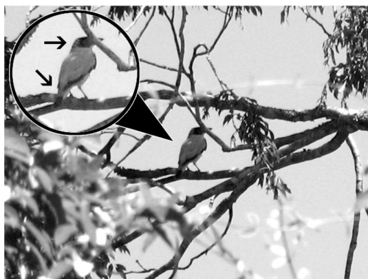
Figura 1. Macho de Tueré Enmascarado ( Tityra semifasciata ) fotografiado el 17 de enero de 2008 en el Parque Nacional Iguazú, Misiones, Argentina. Las flechas indican dos caracteres diagnósticos de la especie: la nuca clara y la máscara en forma semicircular, y la cola blanca con una banda subapical negra (por la distancia no se observa una muy delgada línea blanca apical que fue observada en el campo).

Existe una considerable variación geográfica en las tres especies del género Tityra . Las subespecies presentes en el extremo austral de su distribución son Tityra semifasciata semifasciata , Tityra cayana braziliensis y Tityra inquisitor inquisitor (ver Olrog 1979, Fitzpatrick 2004). En Argentina, Tityra semifasciata semifasciata puede ser confundida únicamente con la subespecie Tityra cayana braziliensis (esta subespecie es tan diferente a otras de Tityra cayana que eventualmente podría considerarse especie aparte; Ridgely y Tudor 1994). Los caracteres diagnósticos de los machos de Tityra semifasciata semifasciata que permiten distinguirla de Tityra cayana braziliensis son: (1) escasa extensión de negro hacia los lados de la cara, terminando en un semicírculo y corona blanca (capuchón negro que incluye la nuca en Tityra cayana braziliensis ), (2) plumas de la cola con base y ápice blancos separados por una ancha banda subapical negra (cola totalmente negra en Tityra cayana braziliensis ), y (3) aproximadamente la mitad basal del pico de