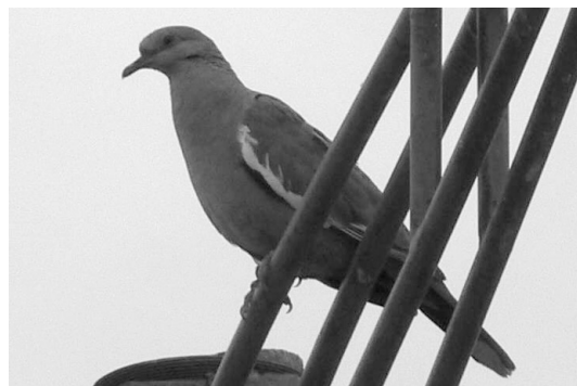
Figura 1. Individuo de Torcaza Alas Blancas ( Zenaida meloda ) observado en Villa Unión, departamento Felipe Varela, La Rioja, Argentina, el 1 de marzo de 2007.

El individuo fotografiado tenía un parche de piel desnuda celeste alrededor del ojo y, en el borde posterior del ala, una conspicua banda blanca (Fig. 1). Su canto recordaba al de la Torcaza ( Zenaida auriculata ), aunque era más melódico, aflautado y rítmico, lo que llamó nuestra atención. Este canto, que grabamos