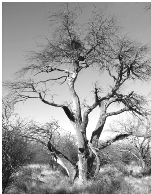
Figura 2. Nido de Águila Coronada ( Harpyhaliaetus coronatus ) en el extremo de las ramas de un caldén muerto en pie, con vegetación gramínea y material combustible en su base, en un bosque de caldén incendiado en la provincia de La Pampa, Argentina.

Observaciones preliminares realizadas utilizando una videocámara en un nido en La Pampa produjeron importante información en relación al cuidado parental, hasta el momento desconocido. Durante enero y febrero de 2004 y enero de 2006 se registraron 450 h de video cubriendo el período entre la incubación y el momento de completo desarrollo del pichón. El 90% del tiempo invertido en la incubación y el cuidado del pichón estuvo a cargo de la hembra. Las actividades consistieron en alimentar, permanecer sobre el pichón durante la noche y brindarle sombra durante las horas de mayor calor. El macho permaneció en el nido sólo cuando aportaba presas y