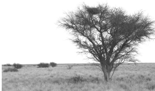
Figura 3. Nido de Águila Coronada ( Harpyhaliaetus coronatus ) en las ramas de un caldén ubicado en un pastizal de pasto amargo ( Elyonurus muticus ) con árboles aislados, en la provincia de La Pampa, Argentina.

Todos los registros de nidificación del Águila Coronada en su área de distribución coinciden en que la puesta es de un único huevo (Giai 1952, de la Peña 1992, Thiollay 1994, Di Giacomo 2005a, Maceda 2005), aunque algunos autores no descartan puestas de dos huevos (De Lucca 1993). El huevo es blanco con pintas y manchitas grises y, en menor cantidad, amarillentas (de la Peña 1992) o blanco opaco e inmaculado (Di Giacomo 2005a). Un huevo reportado por Di Giacomo (2005a) pesaba 132 g y medía 70.8 \times 59.6 mm, y otro huevo hallado al momento de la eclosión pesaba 115 g y medía 66 \times 53 mm (Chebez et al. en prensa). En todos los nidos registrados en La Pampa la puesta fue de un único huevo de cáscara blanca sin manchas y ocurrió entre octubre y noviembre. La incubación duraría