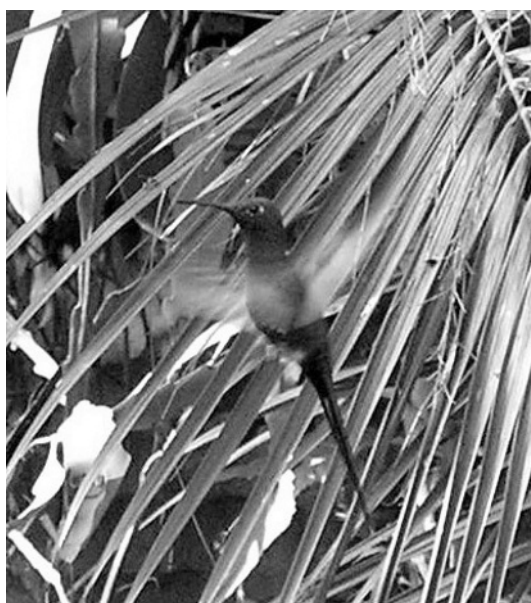
Figura 2. Picaflor Tijereta ( Eupetomena macroura ) en Puerto Iguazú, Misiones, Argentina.