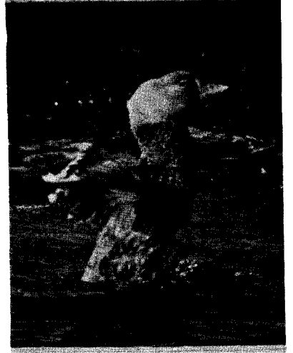
Fig. 2: Carreteo de Tachyeres patachonicus .