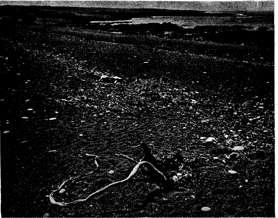
Fig. 3: Nido de Tachyeres patachonicus . Lugar: Punta Tombo (Chubut).