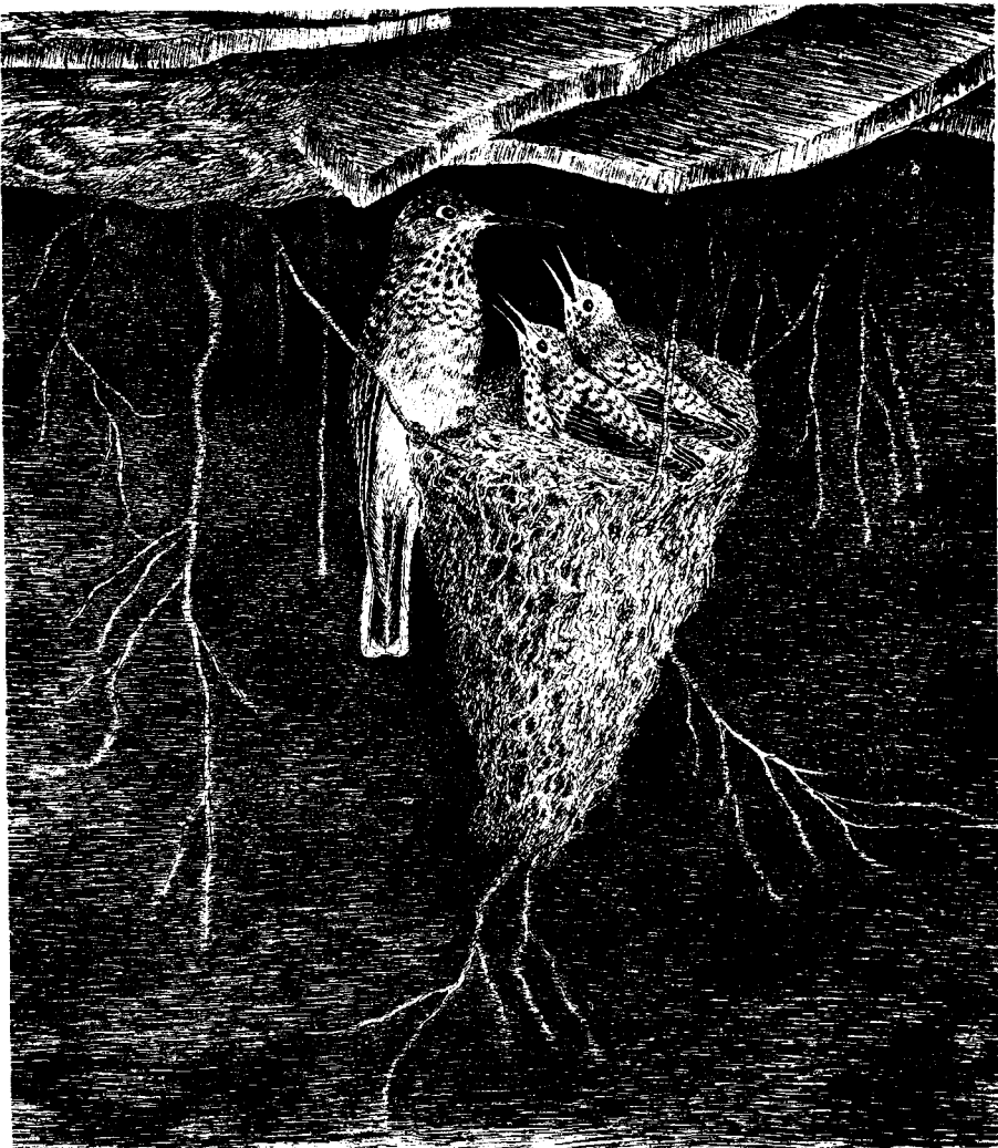
Hembra de Sappho sparganura con pichones de aproximadamente veintidós días.

ALIMENTACIÓN: De unas 50 especies de plantas de diferentes formas y tamaños que crecen en el lugar, sólo unas pocas son usadas para su alimentación. Los más visitados son los arbustos "Pucancho" — Dunalia brachyacantha —, "Sachapera" — Acnistus australis — y la "Granadilla", una Passiflora . Siendo obviamente la primera su principal alimento desde fines de octubre hasta diciembre. Los arbustos mencionados están en plena floración durante el mes de noviembre, con sus ramas largas y