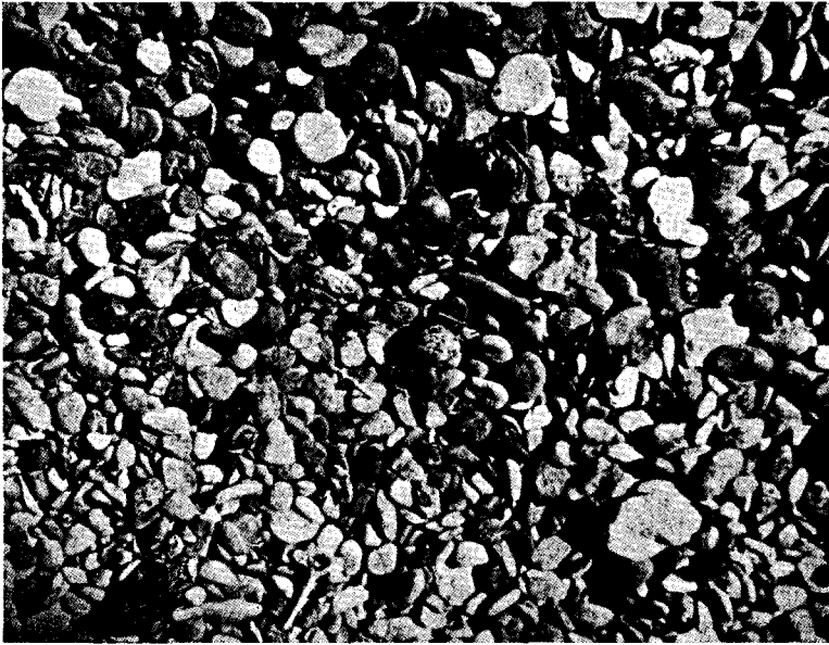
Fig. 1. — Tierra del Fuego. Cabo Viamonte. Nido del Chorlo de Magallanes La nidada se completó luego con un total de cuatro huevos