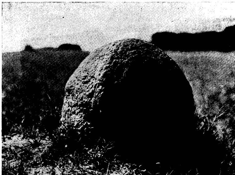
Fig. 2. — Vista del « horno » por el lado de la entrada

En un espacio completamente abierto (fig. 1) y un sitio que debió ser un antiguo hormiguero y quizá tuvo alguna pequeña madriguera, como lo indicaba el espacio de tierra algo más arcillosa, pero hoy completamente asentada, encontramos efectivamente un horno o nido de hornero ( Furnarius rufus ). Estaba recientemente terminado pero no pudimos encontrar el pájaro respectivo, que quizá se ahuyentó con nuestra presencia. La estructura y disposición era la común y el exterior estaba bien acabado. La boca o entrada quedaba hacia la izquierda y mirando hacia el O.