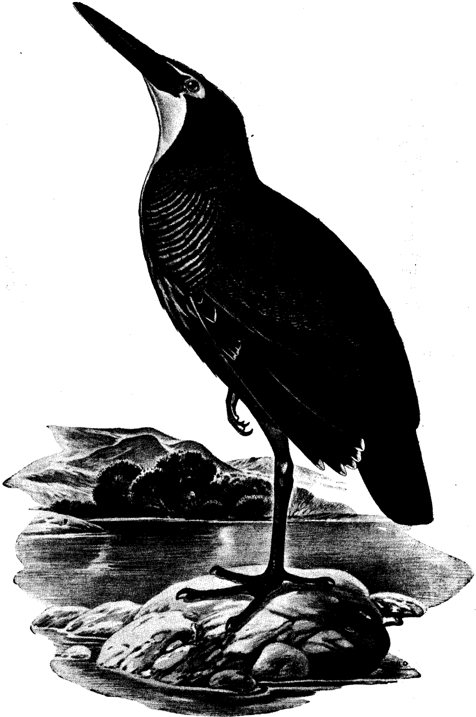
Tigrisoma salmoni brevirostre Sztolcman