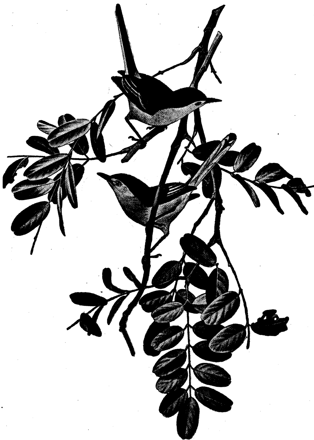
Polioptila lactea Sharpe