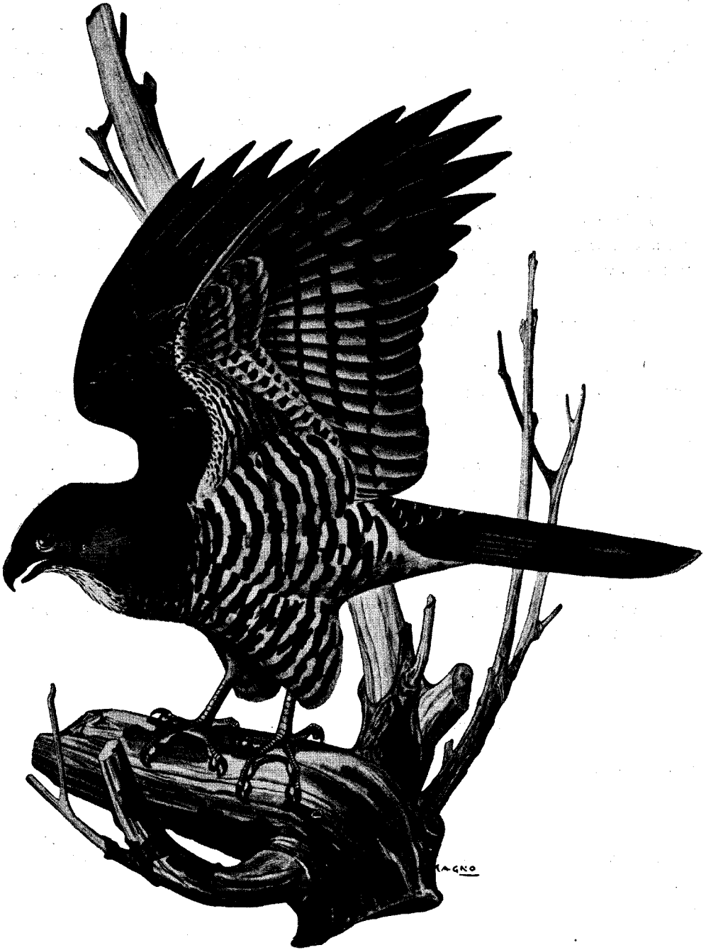
Accipiter pectoralis (Drapiez)