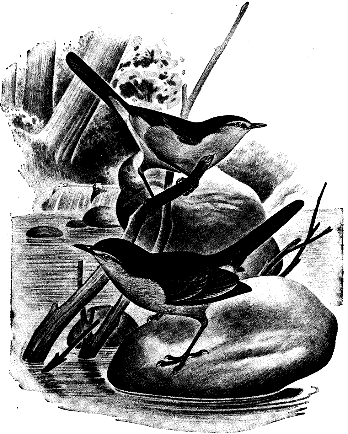
Basileuterus rivularis rivularis (Wied)