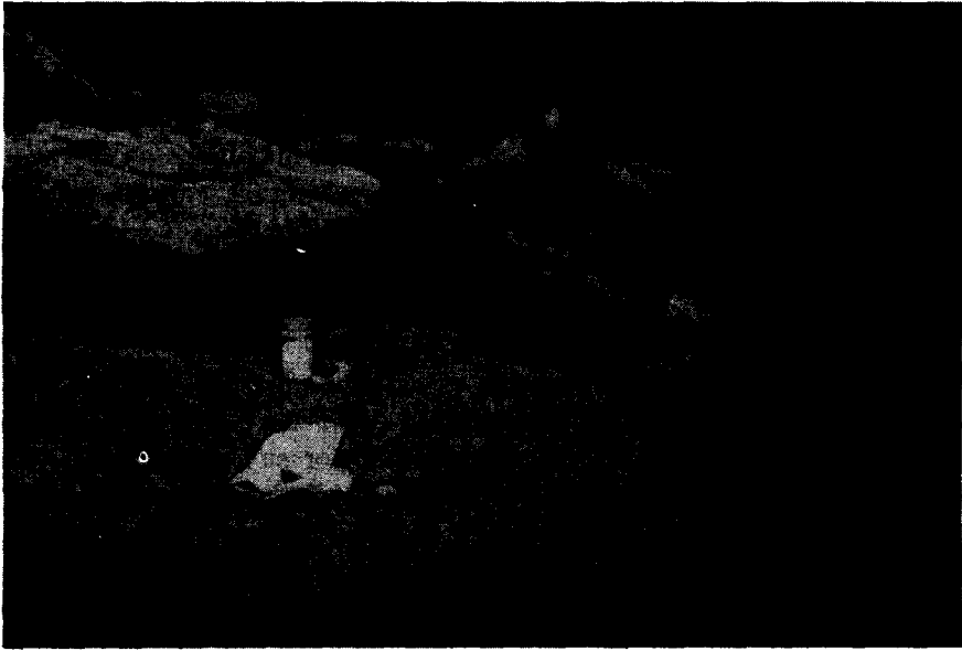
Vista de la pampa en los Comechingones. En primer término el Sr. Zotta cuereando el primer ejemplar de C. comechingonus obtenido.

Distribución geográfica. — Conocida hasta ahora para la localidad típica y Pampa de Achala; probablemente se extienda a lo largo de los Comechingones, en las pampas de más de 2.000 m de altura.