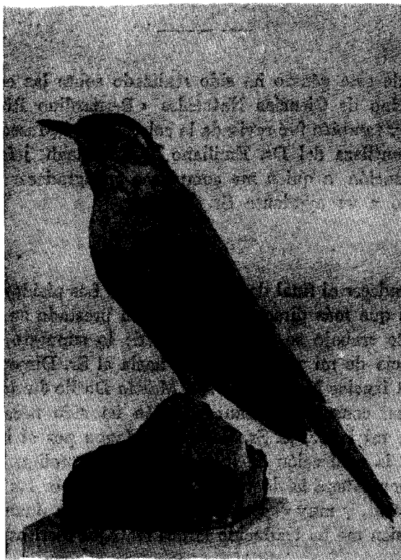
Topotipo del Cinclodes comechingonus . (Reducido \frac{2}{3} aprox.).

Tipo de las Sierras de Comechingones (alt. 2.400 m), a 7 Km al este de La Paz, Provincia de Córdoba, Argentina (Lat. S. 32° 15', long. W. 65°), en el Museo Argentino de Ciencias Naturales N° 45.1, macho adulto, enero 10 de 1945.