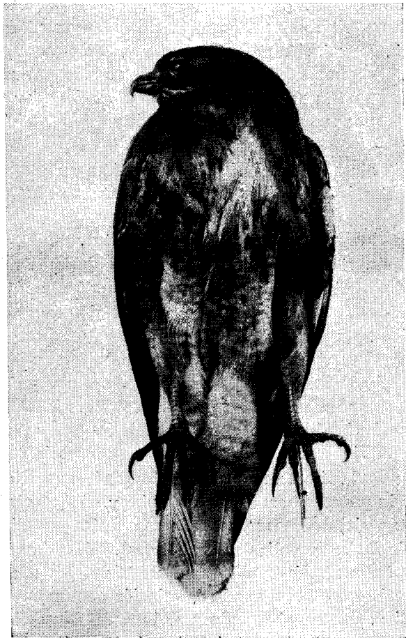
FIG. 2. — Tipo de Buteo macronychus Philippi.

Características. — Ala ♀ 363-375 mm.; exactamente igual al inmaduro de Buteo borealis borealis ; por encima café sepia; rectrices con barras