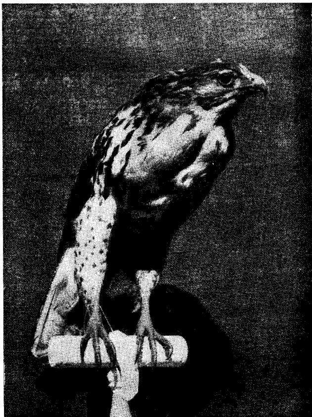
FIG. 1. — Tipo de Asturina picta Philippi. (= inmaduro de Buteo ventralis Goult).

Poco después de iniciado este estudio descubrimos en el Museo de los Padres Redentoristas de San Bernardo un ejemplar idéntico al Tipo de Asturina picta . Este ejemplar había sido colectado por el Padre R.