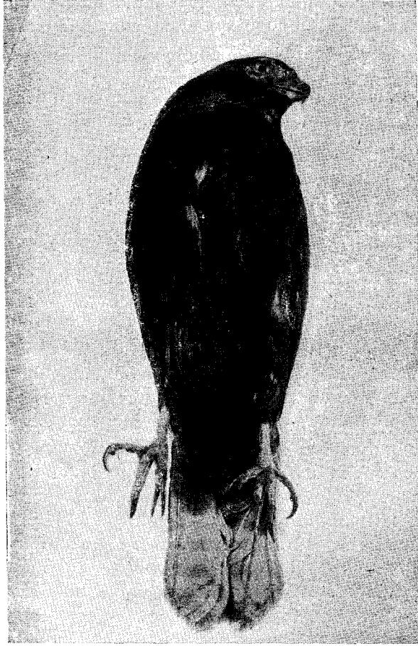
FIG. 3. — Tipo de Buteo ater Philippi. — Foto del U. S. NAT. MUS.

En la lámina de Philippi está representada la hembra, sin embargo el autor hace la descripción del macho, al que consideraremos como el Tipo.