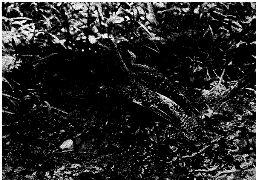
Vista dorso-lateral del mismo ejemplar.

Dicho espécimen presenta el plumaje de verano y ha sido donado por