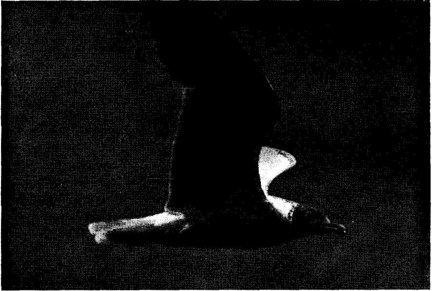
FIG. 1. — Vuelo de la gaviota de capucho café.

Por el camino de esos estudios se está vivificando una nueva biología, salvado el escollo de que ciertos investigadores de la primera hora pretendían reducir a tal estudio y tales temas toda la biología; porque esos señores identificaban cosmos y vida; y por efecto de una reacción excesiva contra los naturalistas de la generación anterior que limitaban la biología al estudio del solo desarrollo de los seres (como si el adulto no formase parte del tiempo y el espacio de la naturaleza), estos otros llamaban biología al solo asunto del estudio de los factores, de los estímulo-