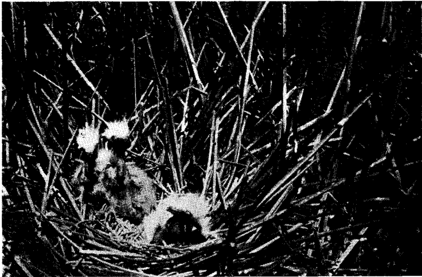
FIG. 3. — Pichones de garza blanca, C. albus egretta , en el nido.

Los nidos de los cuervillos tenían dos y tres pichones, siempre uno de mucho mayor tamaño que el otro y muchos con un huevo huero o próximo a nacer. Los de gaviota, con un pichón recién nacido y dos huevos; otros con sólo dos pichones y un huevo del pato parásito. Cantidad de pichoncitos