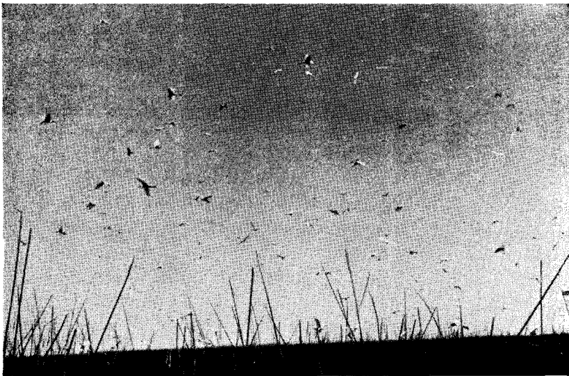
FIG. 2. — Bandadas de garzas y espátulas revoloteando encima del bañado.

A propósito de patos quiero relatar un curioso caso de nidificación. Hace 7 años, la señorita F. Runnacles, que es muy amiga de las aves y