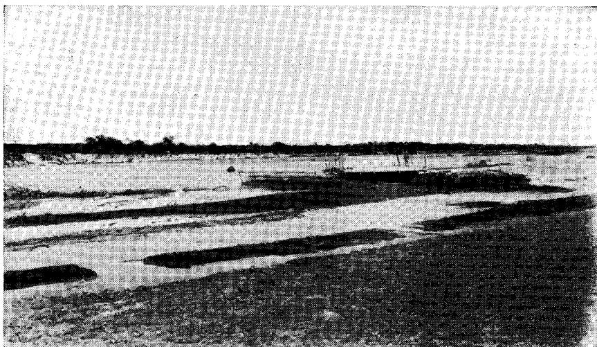
FIG. 1. — Paisajes tucumanos. Termas del Río Hondo, en cuyas márgenes se encuentra el tiránido, Pseudocolopteryx Dinellianus , entre los arbustos de Baccharis lanceolata .

En una pequeña quinta de duraznos, había uno al lado de una galería, tan próximo como un coleccionista podía desear. Principiada la florescencia empezaron a llegar los Heliomaster furcifer (picaflor azul de barbijo). Era esta una especie que me interesaba y desde la galería me acomodé para cazarlos. Traté de cazar todos los ejemplares que se presentaron, de modo que los que no cayeron fueron ahuyentados. Se comprende que los arácnidos, escondidos entre los pétalos, fueron así protegidos y salvados. En fin, terminó la florescencia y los frutos crecieron para madurar a su tiempo.