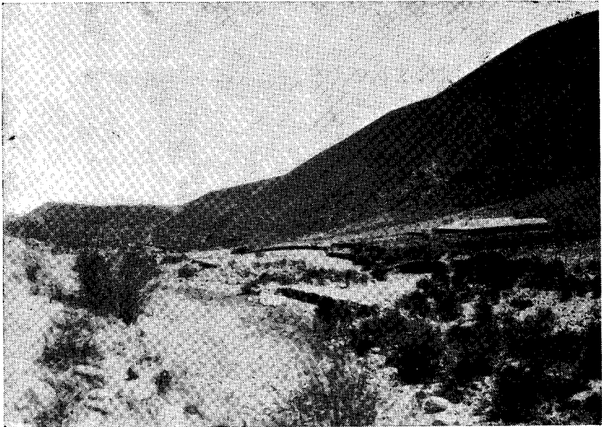
FIG. 3. — El Molle, en la Quebrada de Amaicha (2.900 m.). Al fondo, el Alto del Tío, camino a Los Cardones. Hacia el norte han sido encontrados el loro, Cyanoliseus andinus , y la perdiz, Calopezus intermedius .

Un caso raro de incubación. — Llegué a una casita de campo donde solía permanecer para dedicarme a coleccionar. Un niño, durante mi ausencia, había hallado dos huevos de dormilón, Caprimulgus parvulus . Sabemos que este caprimúlgido pone simplemente en el suelo, sin revestimiento de pajas, hojas u otro material. Los huevos fueron colocados en una lata suspendida cerca de una pared, esperando mi llegada. Cuando me presenté, hacía ya cuatro días que los huevos habían sido recogidos, y por mi parte no me apuré en vaciarlos, sino que esperé unos ocho o nueve días después de la fecha en que fueron encontrados.