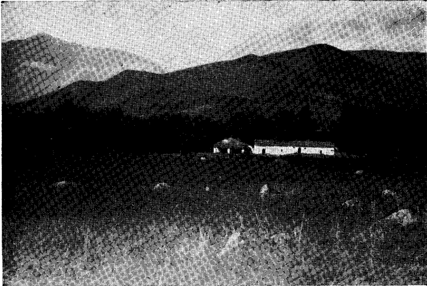
FIG. 4. — Tafi del Valle (2.000 m.). Se divisa el Cerro Nuñorco y la Loma del Medio. Casa almacén del Río Bravo, estada obligada de los que van a las cumbres.

Esta obstinación es corriente en las gallinas, pero nunca pensaba observarla en una avecilla silvestre.