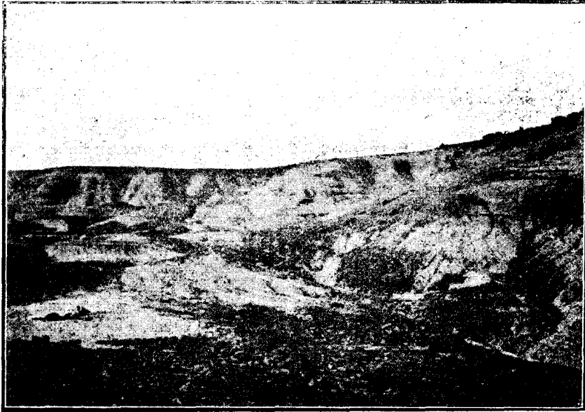
Fig. 3. — Barranca de la Cueva, Lado Sud del Río Santa Cruz.

encuentra en todas partes aunque parezcan preferir los faldeos muy tendidos que ofrecen más reparo al viento. En la gran extensión de pampas comprendidas entre Río Coyle y el Río Santa Cruz, se las puede observar tanto en los manchones de mata negra ( Verbena tridens ) como en la parte más limpia de una laguna seca, donde van en procura de una planta ( Pernettya pumila ) de la que hacen gran consumo, a juzgar por la cantidad que ha encontrado en los buches de seis que examinó el señor José F. Molfino, (1) y que fueron cazadas en distintos sitios. Puede ase-