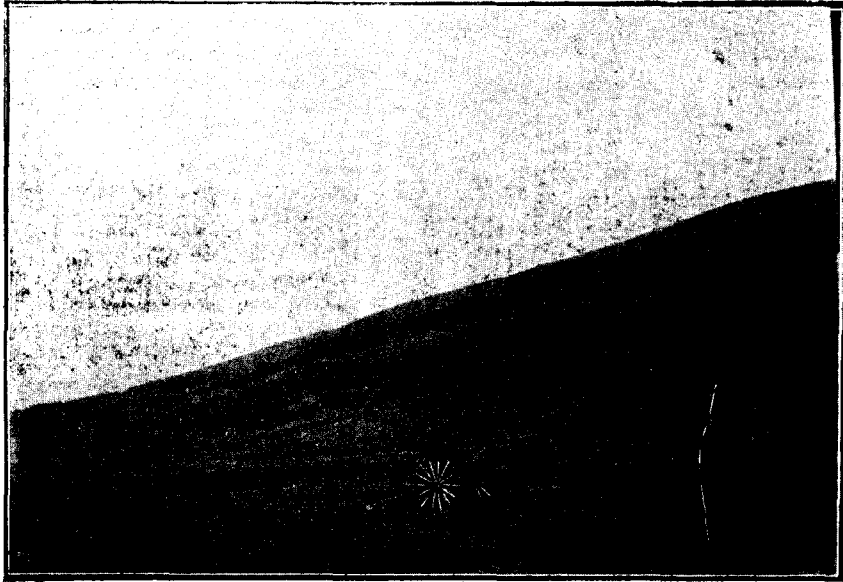
Fig. 2.-- Otra vista de Aguada Grande (Sta. Cruz).

próximos a nuestro destino, alcanzamos a ver tres perdices que corrían con bastante rapidez, delante del coche que marchaba a regular velocidad, sin darles alcance, hasta que dejando el camino se escurrieron por entre los arbustos que lo bordean escondiéndose entre ellos con tanta maestría, que nos fué imposible encontrarlas ni conseguir levantarlas con un perro de caza, que de exprofeso llevé conmigo. Creo que fueron las mismas las que encontré muy cerca del mismo sitio el día siguiente, pero en cuanto notaron que el perro las había descubierto, volaron a gran distancia de