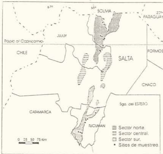
Figura 1. Esquema de la distribución de las Yungas de Argentina y los sitios muestreados. Los puntos en el mapa corresponden a uno o más sitios muestreados.

Figure 1. Scheme showing the distribution of Argentina Yungas and sample sites. Dots correspond to one or more sample sites.