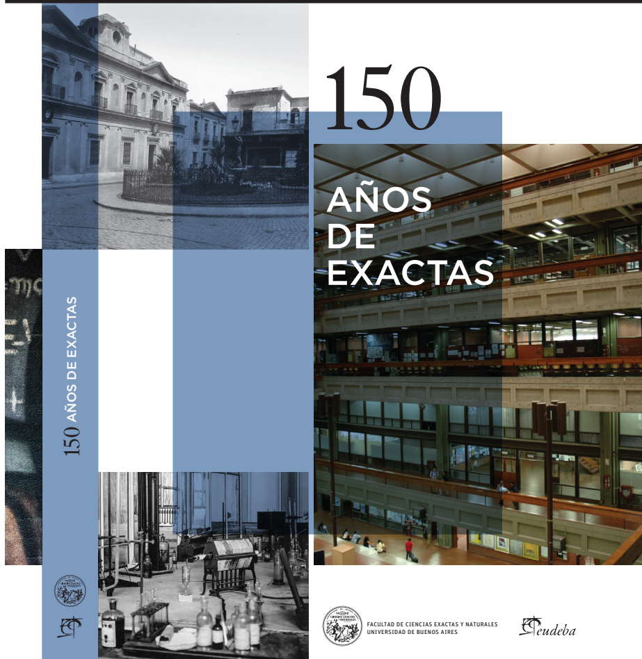
Diseño de tapa del libro "150 años de Exactas", que se encuentra en etapa de impresión.