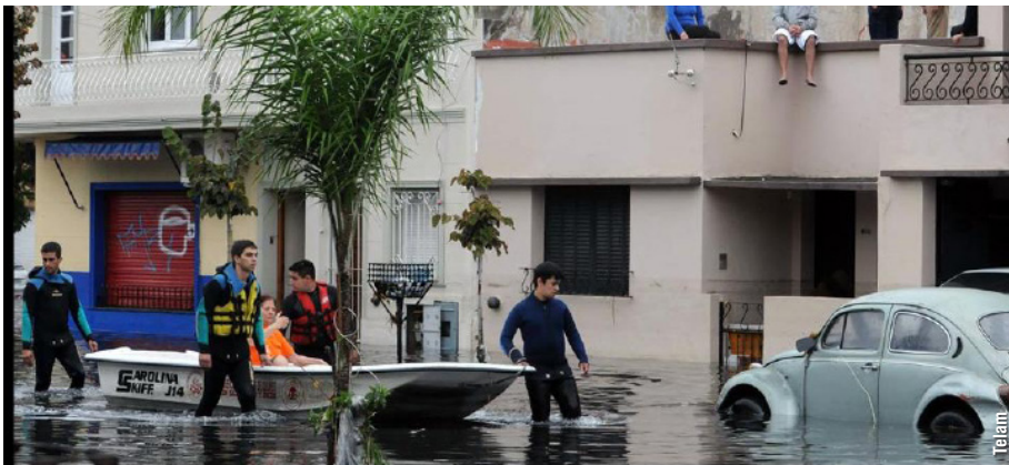
Pág. 2 ►

Décadas de conocimiento generado en la Facultad sobre eventos meteorológicos severos entran en sinergia con la iniciativa de los investigadores, las necesidades del Servicio Meteorológico y la capacidad tecnológica que ofrece actualmente el país. El proyecto Alert.ar ya está en marcha con expectativas de mejorar la calidad e inmediatez de los pronósticos, generar alertas tempranas y, de esa manera, disminuir el impacto de las tormentas en la población.