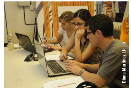
Pág. 5 ►

Del 21 al 23 de octubre se llevó a cabo la segunda edición de esta actividad que fue la última en incorporarse al programa Semanas de las Ciencias. En esta oportunidad 100 docentes y estudiantes de profesorado de escuelas secundarias de la Ciudad y la provincia de Buenos Aires participaron de talleres, conferencias y laboratorios de ideas, entre las diferentes propuestas.