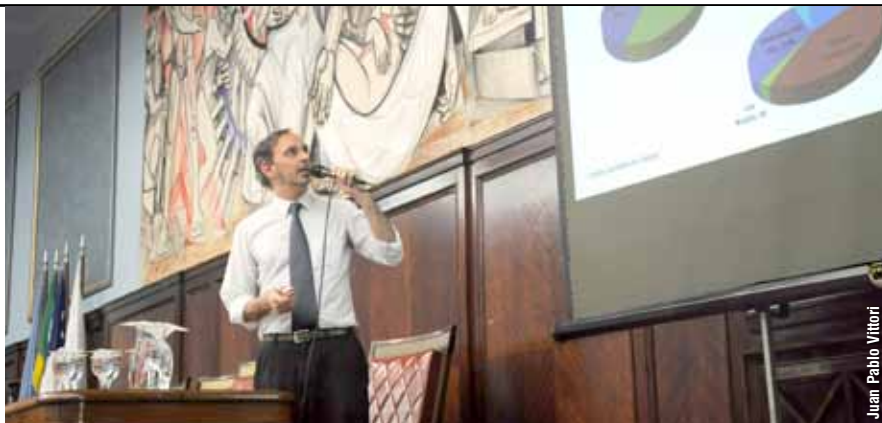
Una de las medidas que impulsa Tanides es la prohibición de los pilotos de los artefactos a gas. “La cantidad de gas que desperdician los millones de pilotos de calefactores, termotanques, calefones, que hay en Argentina, es la misma que utiliza una central termoeléctrica de ciclo combinado para generar unos 800 MW de potencia. Piensen que Embalse produce 600 MW”.

“¿Se puede cuantificar el impacto de este tipo de medidas?”, se preguntó el ingeniero. Diversos estudios dieron cuenta de que, para el caso de las heladeras, el etiquetado generó, en sólo dos años, entre 2005 y 2007, un apreciable corrimiento del mercado hacia los modelos