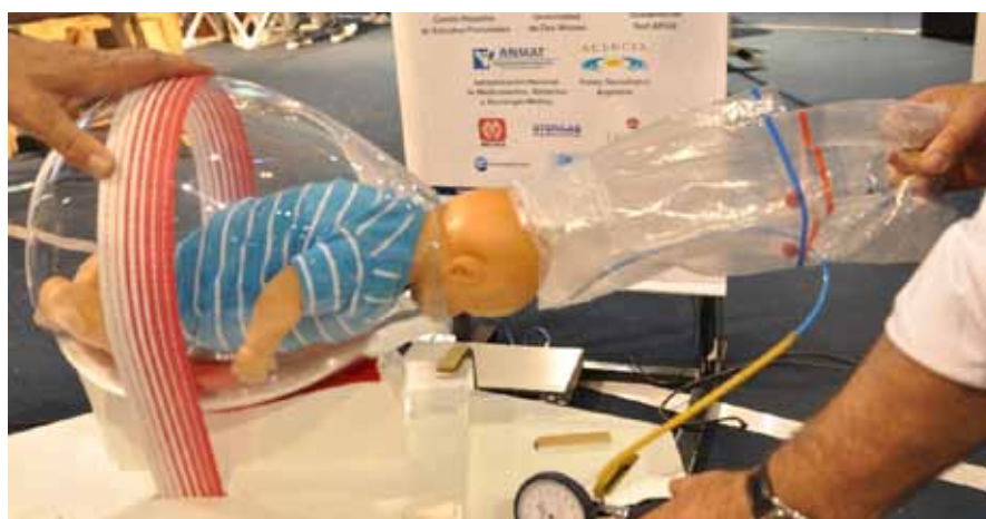
El proyecto Odón Device, uno de los máximos ganadores, es un dispositivo manual facilitador de partos naturales. Está compuesto, básicamente, por film de polietileno.