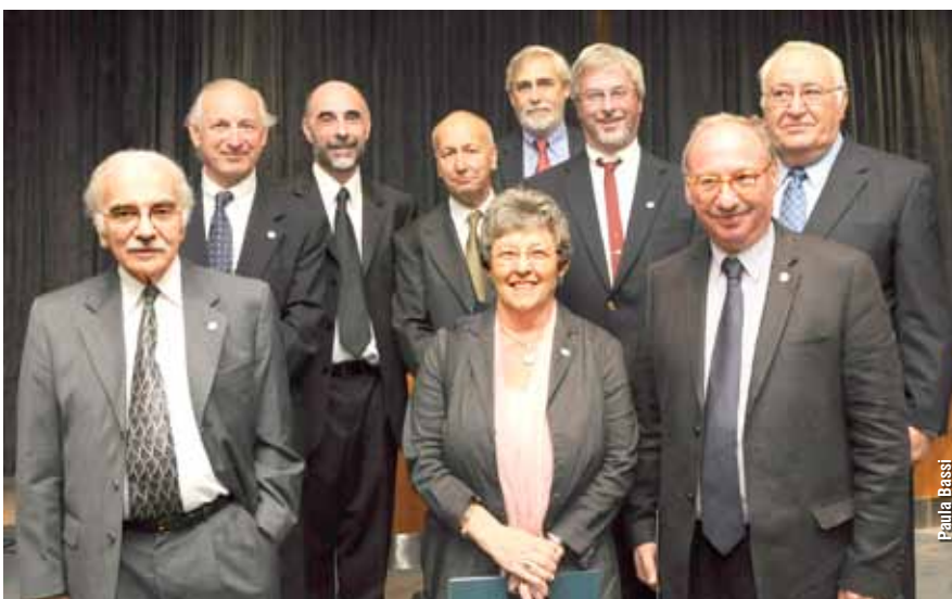
Finalizada la ceremonia, los investigadores egresados de Exactas que fueron premiados, posaron junto con las autoridades de la Facultad.

El cierre estuvo a cargo del ministro Barañao. "Como bien decía el doctor Housay, la ciencia no tiene patria pero los científicos sí, algo que ha sido reiterado por muchos de ustedes en sus palabras de agradecimiento. En general, a los científicos se los premia por el reconocimiento de sus pares, y esto está asociado a algún hallazgo particular, a alguna contribución abstracta o algo que beneficie a la humanidad, con lo cual no hay una connotación afectiva fundamental en ese tipo de reconocimiento", dijo Barañao refiriéndose a los premios tradicionales a la labor científica. Y los comparó con el RAICES, "esto es todo lo contrario, lo importante es la connotación afectiva. Nosotros queremos agradecer a todos los argentinos a los que consideramos parte del tejido social de nuestro país y que están contribuyendo de manera muy eficaz a la mejora de la calidad de vida de la gente y también a los ciudadanos de otros países que en muchos casos también han colaborado con el desarrollo de la ciencia en nuestro país".