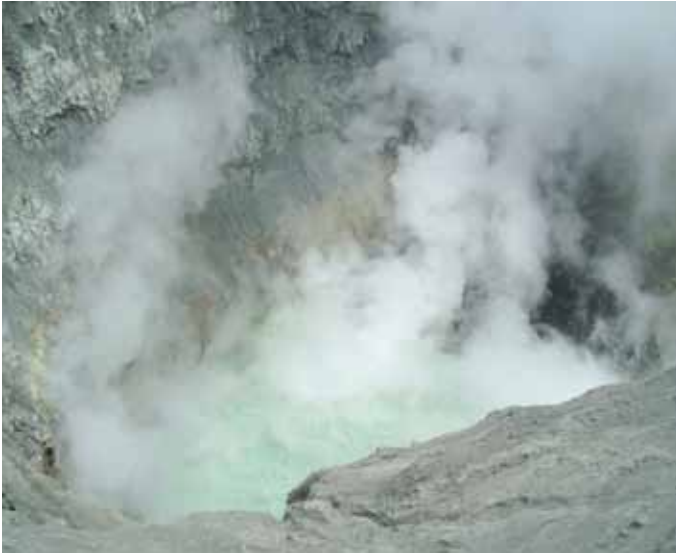
Vista del interior de uno de los cuatro cráteres del volcán Peteroa donde se observa la presencia de un lago cratérico y fumarolas que se desprenden formando una columna de gas y vapor de varios metros de diámetro