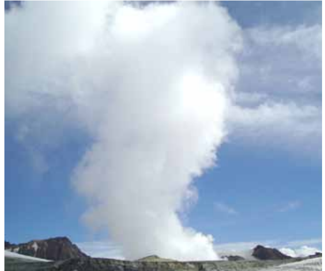
Vista de la fumarola del Peteroa desde el borde de la caldera volcánica.

Sacks, Caselli agrega que “a principios de 1900 y en 1960 hubo dos terremotos bastante importantes en el centro de Chile y que se pudo comprobar un posterior aumento en las erupciones. En el caso de 1960, entraron en actividad siete volcanes andinos, entre ellos el Peteroa, el Copahue, el Villarica y el Tupungatito, además de varios volcanes chilenos”.