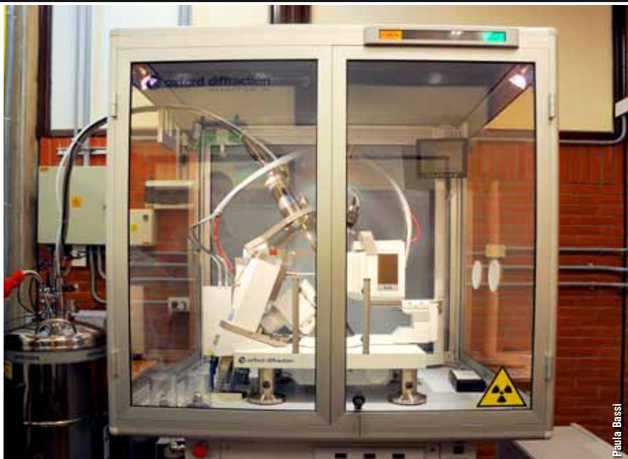
Nuevo difractómetro de rayos X para estudiar monocristales. Permite realizar en minutos u horas estudios que demoraban días con los equipos antiguos existentes en el país.

- Otra aplicación surge en relación con las lentes de contacto. Para eso estamos en conversaciones con la empresa Pfortner. El tema es así, las lentes de contacto se hacen con un material que les da su propiedad mecánica, o sea el ángulo que tiene la curvatura. Si vos querés, además, tener un determinado color de ojos, basta con poner una sola capa de moléculas de un colorante y listo. Es decir, una cosa es el material que le da sus propiedades físicas, la curvatura y otra cosa es el que le da el color. Si querés que también permee oxígeno para que la córnea respire entonces se hacen de poliuretano pero el poliuretano es muy hidrofóbico, lo que provoca que la lente se pegue a la córnea. Lo que se ha desarrollado, y de hecho son tecnologías