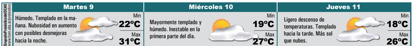
Pág. 6 ►