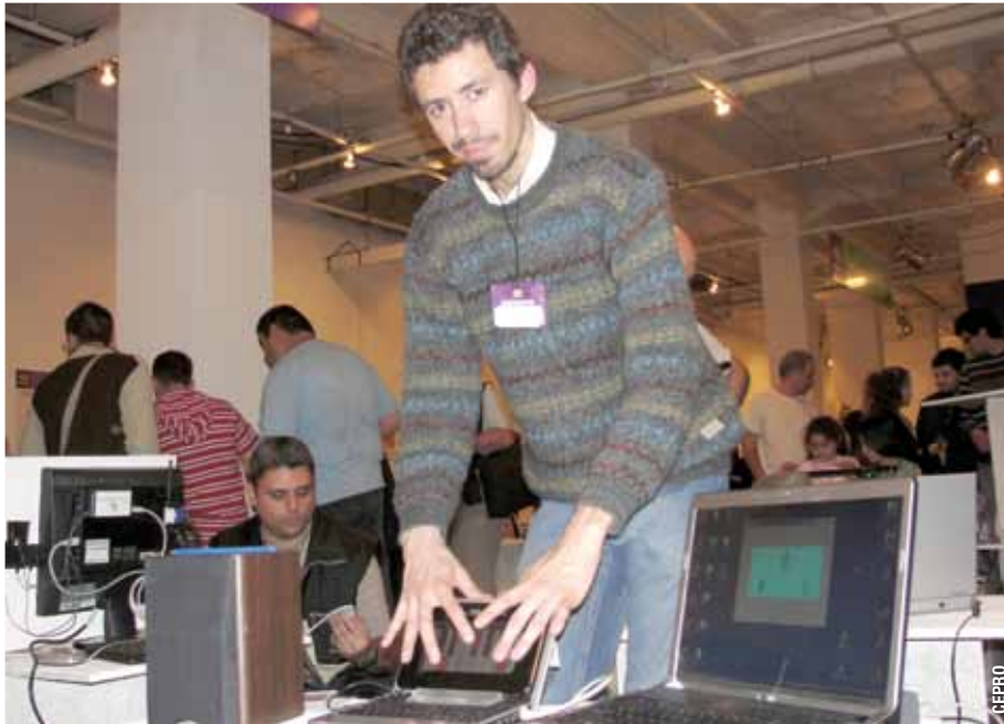
Pág. 3 ►

Una vez más, gente de Exactas pisa fuerte en el Concurso Nacional de Innovaciones. Esta vez fue el turno de un alumno de Ciencias de la Computación, que se llevó el premio mayor por una pantalla multitáctil que incorpora notables mejoras frente a las tradicionales, como mayor sensibilidad y versatilidad. También abarata costos de producción. El proyecto comercial se está trabajando en Incubacén, la incubadora de empresas de Exactas.