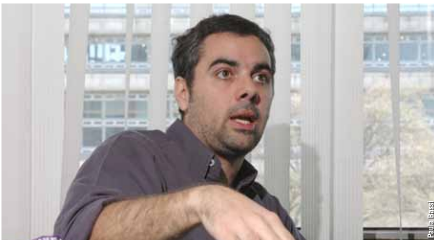
"Si uno estudia las consecuencias que tuvo el aumento de la temperatura en el Cretácico con respecto a la diversidad de plantas y de invertebrados o a la distribución de comunidades biológicas, uno puede hacer proyecciones acerca de lo que puede llegar a pasar a partir del actual cambio climático global", explica Lazo.