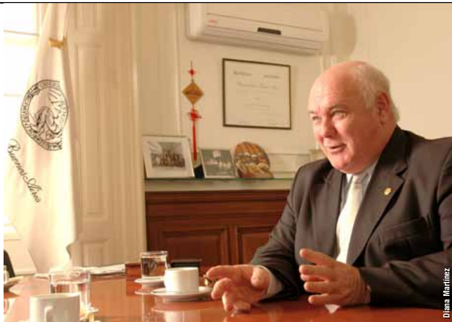
"A nosotros no nos pidieron que avalemos nada y no avalaremos nada con lo que no estemos de acuerdo. La UBA toma un problema, lo estudia y emite su opinión. Yo espero que la Universidad pueda hacer una propuesta integral, apuesto a eso", sostiene el rector.

- Me parece que acá cada uno debe cumplir su misión, y para reclamar por las situaciones laborales están los sindicatos, que están peleando por los trabajadores del INDEC y me parece que eso es lo correcto. La Universidad no es un sindicato, además, hay que dejar bien en claro que no avala la situación actual del INDEC, y eso muchas Facultades ya lo han declarado públicamente. A ver... Cuando se nos convoca a solucionar un problema no podemos negarnos porque en el lugar