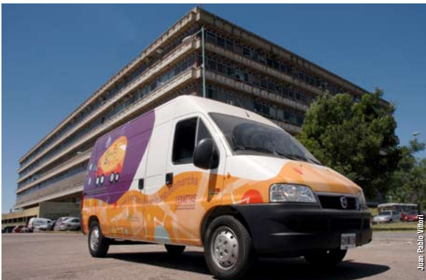
En noviembre llegó a Exactas una camioneta destinada al programa “Ciencia en Marcha” provista por el Ministerio de Ciencia, Tecnología e Innovación Productiva.

Este año, la DOV también publicó su segundo libro, que tuvo su presentación formal el 26 de noviembre pasado. “Ciencia para elegir” es un trabajo que describe cada una de las carreras que se dictan en Exactas, con un fuerte acento en el tratamiento de la información. “Este libro no está pensado como una guía tradicional, sino como un material que den ganas de leerlo, con un