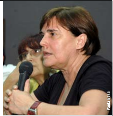
"El tratamiento con cianuro, además del oro, va a liberar otra serie de minerales que son tanto o más tóxicos que el cianuro", aseguró dos Santos.

y que son sustentables gracias a la implementación de distintas técnicas de riego para aprovechar al máximo el agua que proviene de los glaciares de montaña o de los acuíferos. "La enorme cantidad de agua que requiere este tipo de minería hace que resulte imposible su coexistencia con la agricultura. Hay que recordar que La Rioja forma parte del 75 por ciento del territorio argentino que es árido y semiárido".