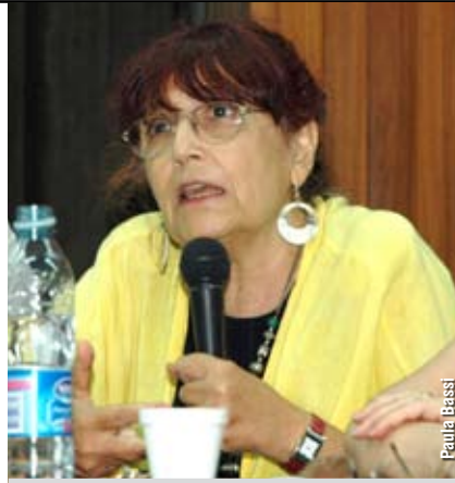
"La enorme cantidad de agua que requiere este tipo de minería hace que resulte imposible su coexistencia con la agricultura", sostuvo Giarraca.