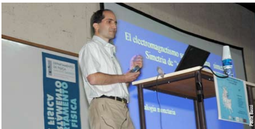
“Alguna de las cosas que voy a decir van a parecer muy extrañas, casi increíbles. Parecen cosas que ocurren solo en los cuentos de hadas. Pero la naturaleza es más extraña que un cuento de hadas”, sorprendió Maldacena en el inicio mismo de la charla.

El bosón de Higgs es una partícula elemental hipotética cuya existencia es predicha por el Modelo Estándar, que interactuaría con todas las demás y a partir de esa interacción les generaría su masa. Sin embargo esta partícula, hasta