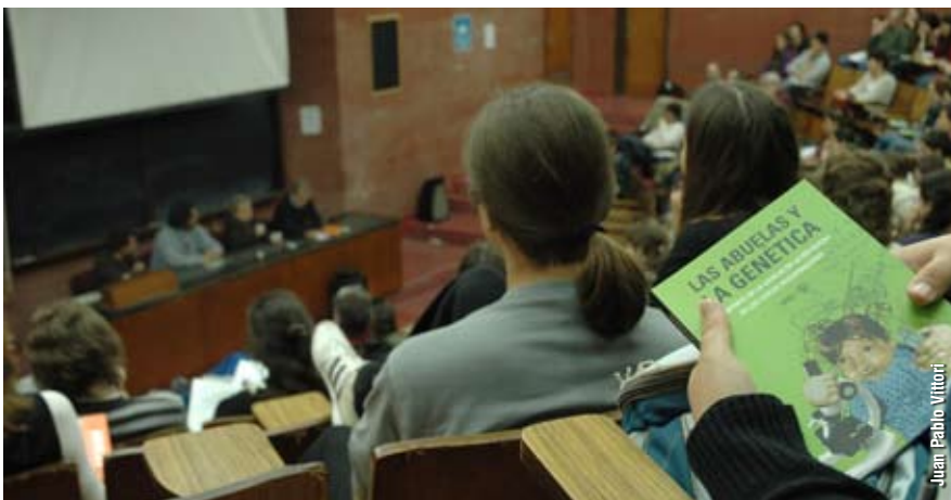
Cerca de 200 personas se reunieron en el aula 6 para participar de la presentación del libro "Las Abuelas y la genética: el aporte de la ciencia en la búsqueda de los chicos desaparecidos", La obra relata el recorrido que permitió llegar a obtener técnicas y herramientas para devolver la identidad a quienes sufrieron su robo durante la última dictadura.

Dentro de cada una de nuestras células existe un núcleo que contiene la información genética completa de todo nuestro organismo, codificado en el ADN nuclear. Y también dentro de cada una de nuestras células existe una gran cantidad de unas estructuras llamadas mitocondrias, que son las encargadas de proveer la energía necesaria para la actividad celular. Esas mitocondrias tienen, a su vez, un ADN propio que tiene una particularidad: se hereda únicamente por parte materna. Con esta consideración, se salvaron los dos obstáculos que complicaban la identificación.