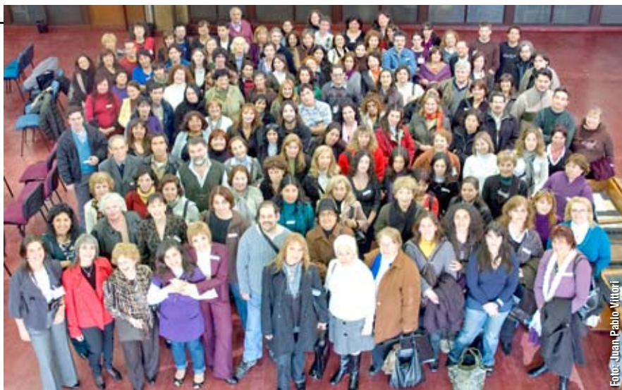
Más de 250 miembros de todas las bibliotecas y centros de documentación de la UBA, disfrutaron de las distintas actividades que se desarrollaron durante la 4ª Jornada de Bibliotecas.

“¿Piensan que dije algo tramposo? –preguntó Etchenique-. Cuando uno lee, no ve simplemente una serie de trazos y los transforma en información. Nadie lee así. Uno lee imágenes y esas imágenes alcanzan zonas profundas del cerebro. Eso se puede ver con técnicas avanzadas llamadas MRI (Magnetic Resonance Im-