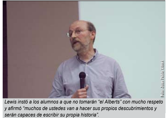
Lewis instó a los alumnos a que no tomarán "el Alberts" con mucho respeto y afirmó "muchos de ustedes van a hacer sus propios descubrimientos y serán capaces de escribir su propia historia".

es que la gente se involucre seriamente en la ciencia. La racionalidad es muy importante en una sociedad democrática".