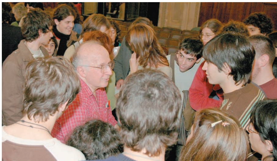
Roald Hoffmann rodeado de estudiantes secundarios

En su afán por establecer relaciones entre la ciencia y el arte, Hoffmann afirmó: “Estas estructuras sencillas tienen un sentido arquitectónico, parecen obras de arte. Pero también podemos construir moléculas de complejidad similar a la de la hemoglobina”.