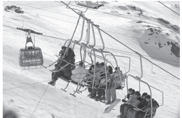
Accidente de aerossillas en el cerro Catedral, agosto de 2004

Las mordazas constan de un gancho que aprieta el cable, una tuerca y una contratuercas, y la fuerza se ejerce a través de un resorte. La luz de la mordaza dice cuán apretado está el resorte y, con este dato, se conoce la fuerza sobre el cable.