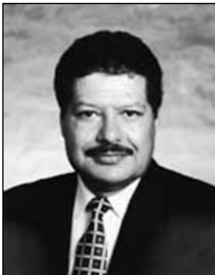
Ahmed Zewail. Premio Nobel de Química 1999.

El evento contará con un servicio de traducción simultánea.