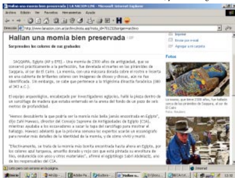
La Nación, miércoles 4 de mayo de 2005

Las presentaciones deben dirigirse a la Comisión Nacional Argentina para la UNESCO, Pizzurno 935, oficina 231, Buenos Aires.