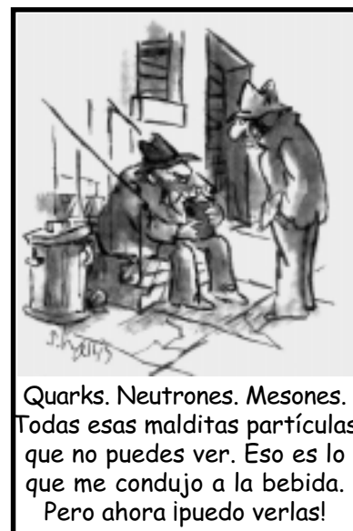
Quarks. Neutrones. Mesones. Todas esas malditas partículas que no puedes ver. Eso es lo que me condujo a la bebida. Pero ahora ¡puedo verlas!

«Los quarks interactúan muy fuertemente a energías bajas (cuando están separados por grandes distancias). Esto indica que están confinados dentro del protón debido a la gran fuerza que los une y es muy difícil separarlos -explica Florian-. Pero, a energías grandes (cuando la distancia que los separa es pequeña),