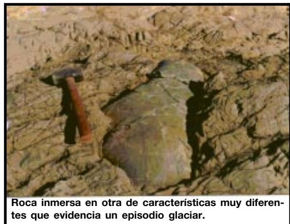
Roca inmersa en otra de características muy diferentes que evidencia un episodio glacial.

El análisis de los sedimentos fue complementado con datos paleomagnéticos obtenidos por la doctora Leda