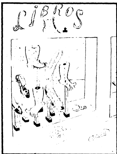
Ilustración de "Alpargatas sí, libros no", historieta del periódico "ANTINAZI"

La mañana del 17 de octubre miles de trabajadores marcharon sobre Plaza de Mayo; la plaza que había sido escenario de gestas nacionales recibía ahora a nuevos protagonistas de la política. Una sociedad porteña, orgu-