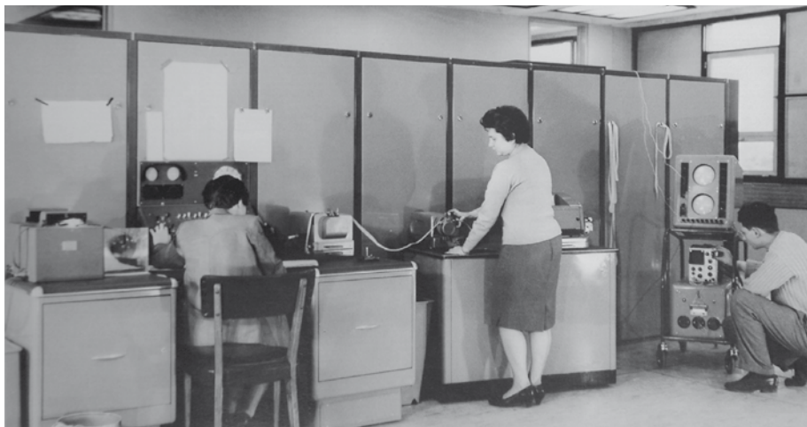
Pág. 2 ►

En el marco de las "Jornadas Manuel Sadosky", que conmemoraron los 50 años de la inauguración del Instituto de Cálculo, el matemático español Ernesto García Camarero, por entonces Jefe de Programación de esa institución, transportó al auditorio a la época en la que el término "informática" estaba aún por inventarse. El encuentro fue organizado por el Departamento de Computación y la Fundación Sadosky.