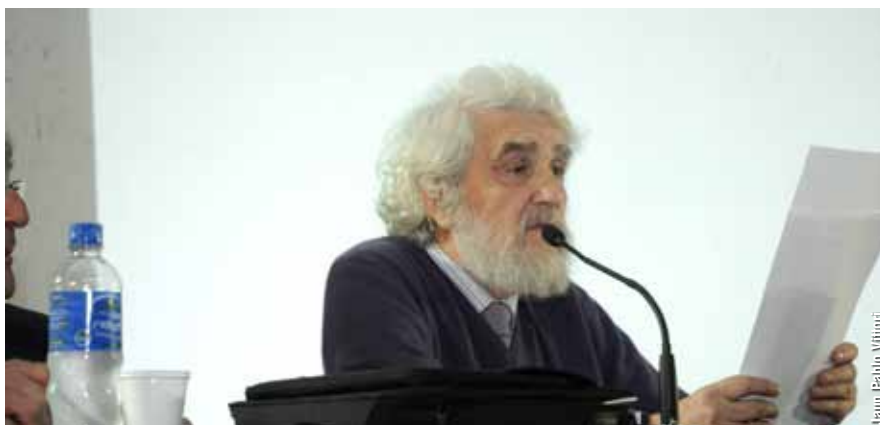
“Cuando llegó la Mercury a Buenos Aires, en 1961, este tipo de máquina acababa de aparecer. En Argentina se estaba todavía a tiempo de participar en el desarrollo mundial de esta nueva ciencia y tecnología. Era un momento en el que se estaba a nivel mundial”, reflexiona Camarero.

Al principio, dar a conocer los servicios que podía brindar el IC era una prioridad. Según recuerda Camarero, para dar los cursos iniciales de programación se había invitado, por un lapso de tres meses, a la