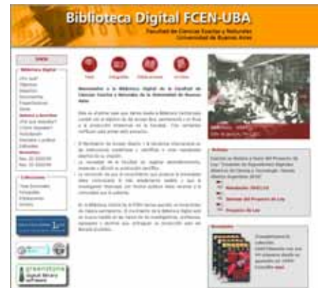
Pág. 4 ►

A un año de su aparición en la web, la Biblioteca Digital de la Facultad creció fuerte tanto en la cantidad de materiales que ofrece libremente como en el número de consultas que recibe. Desde Europa mostraron interés por algunas de las tesis doctorales ya publicadas. El próximo paso es avanzar sobre los papers.